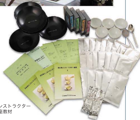
インストラクター講座教材