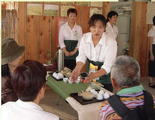
愛・地球博「茶の宴」