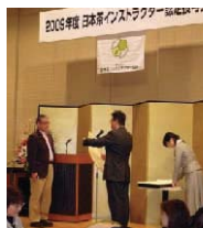
日本茶インストラクター認定式