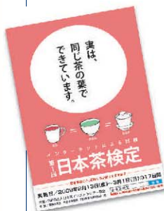
第1回日本茶検定PRリーフレット

多くの方々に日本茶への関心を持っていただくため、クイズ感覚で手軽に受検できるよう、インターネットによる検定試験を開設。同時に、公式テキスト「日本茶のすべてがわかる本」(発売:農文協)を企画、編集。毎年2・6・10月の年3回開催しています。