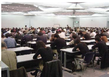
日本茶インストラクター1次試験