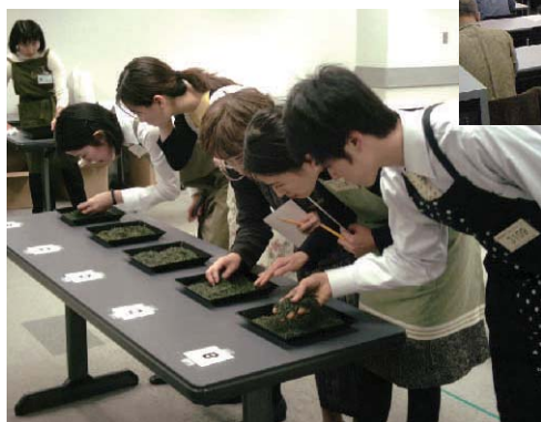
日本茶インストラクター2次試験